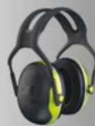
3M™ PELTOR™ Schutz ohne Kommunikation

Mehr Informationen und Bestell-Option: http://go.3M.com/polizeitraining