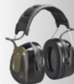
3M™ PELTOR™ Kommunikations-Lösungen zur Verständigung mit dem Schiess-Trainer.