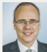
Peter Beuth (CDU) ist Hessischer Minister des Innern und für Sport.

„DEN SCHUTZ DER KOLLEGEN DURCH TECHNISCHE INNOVATIONEN ZU VERBESSERN UND DIES AUF DAS GESAMTE LAND AUSZUWEITEN, IST NUR EINE KOMPONENTE UNSERES HESSISCHEN MASSNAHMENPAKETS.“