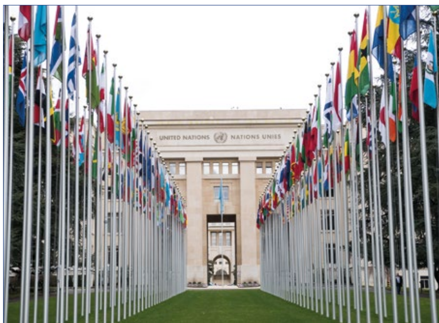
Zwölf Friedenseinsätze haben die Vereinten Nationen im Sommer 2020 durchgeführt, in denen fast 9.000 Soldaten eingesetzt waren. Die deutsche Beteiligung fiel sehr gering aus.

Das Thema Transitionen bewegt nicht nur UNPOL, aber dieser kommt eine besonders zentrale Rolle zu. Dabei geht es um die Frage, wie ein Friedenseinsatz beendet werden kann, ohne die Nachhaltigkeit des Erreichten zu gefährden oder den Rückfall in einen Konflikt zu verantworten. Oftmals ist es die langfristige Förderung der Rechtsstaatlichkeit, die über eine Mission hinaus fortgeführt werden muss. In manchen Fällen setzt sich die Arbeit in einer neuen, aber anders ausgerichteten Folgemission fort. So bemüht sich UNPOL aktuell darum, in Sudan die Kontinuität im Übergang des Blauhelmeinsatzes UNAMID zu einer neuen politischen Mission UNITAMS zu sichern und die Erfolge im Aufbau der haitischen Polizei im Rahmen der kleinen, politischen Mission BINUH zu untermauern. In anderen Fällen wird z. B. die Aufbauarbeit nach