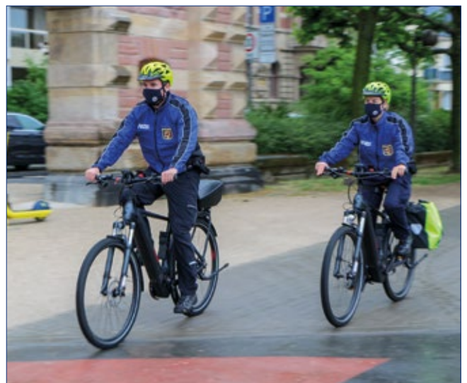
Der Startschuss für den Einsatz von Pedelecs bei der Landespolizei Rheinland-Pfalz fiel im Juni 2020.

Auch die Bestreifung von Wohngebieten in den Abend- und Nachtstunden, beispielsweise zur Vorbeugung und Aufklärung von Wohnungseinbrüchen, wird erprobt. Ein Streifenwagen ist weithin sichtbar, mit einem Fahrrad kann sich die Polizei hingegen lautlos und unauffälliger nähern und die eingesetzten Polizistinnen und Polizisten nehmen deutlich mehr wahr als die Kollegen im Auto. Weitere neue Aufgabenfelder können auch Fahndungsmaßnah-