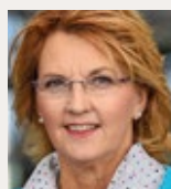
Susanne Mittag , MdB, ist Mitglied im Innenausschuss des Deutschen Bundestages für die SPD-Fraktion.

abgerufen werden können. Insgesamt sollten wir einen Umgang finden, um den Kollegen, die von der Bundesregierung in mitunter heikle Auslandsmissionen geschickt werden, spürbar mehr Wertschätzung zu zollen und sie für die auch politisch wichtige Mission zu honorieren. Damit Heimkehrende, die in Ländern wie Mali, Sudan oder eben Afghanistan ihren strapaziösen Dienst verrichtet haben, nicht mehr den Eindruck haben müssen, sie hätten mit dem Auslandsengagement in ihrem Fortkommen im Dienst die Pause-Taste gedrückt.