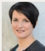
Dr. Irene Mihalic, MdB , ist Sprecherin für Innenpolitik der Fraktion Bündnis 90 / Die Grünen.

die Zusammenarbeit der Sicherheitsbehörden entsprechend international aufzustellen. Selbst nationalistisch gesinnter rechter Terrorismus ist, wie wir heute wissen, in Deutschland längst international vernetzt. Internationale Polizeimissionen leisten dabei von jeher in allen Terrorismusfeldern einen wichtigen Beitrag zur Terrorismusbekämpfung, nicht zuletzt, indem sie Rekrutierungs- und Rückzugsräume schließen. Auch im Hinblick auf das organisierte Verbrechen gibt es insofern viel zu tun – vor der eigenen Haustür und global. An verstärkter internationaler polizeilicher Zusammenarbeit führt jedenfalls auch unter Präventionsgesichtspunkten kein Weg vorbei.