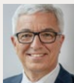
Roger Lewentz (SPD) ist Staatsminister im Ministerium des Innern und für Sport des Landes Rheinland-Pfalz.

Doch auch jetzt wissen Lamborghini-Fahrer in Worms schon, dass man sich vor Polizistinnen und Polizisten auf Stahlrössern ganz besonders in Acht nehmen muss.